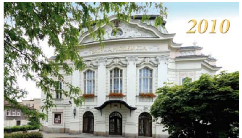
Budynek Teatru im. A. Mickiewicza

Zapraszamy Czytelników do współredagowania tej kolumny. Prosimy o nadsyłanie ciekawostek związanych z Cieszynem (np. anegdot, przepisów kulinarnych, zdjęć, dokumentów, wzorów rękodzieła artystycznego itp.), które mogłyby zainteresować innych i wzbogacić wiedzę o naszym mieście. Gwarantujemy zwrot wszystkich otrzymanych materiałów.