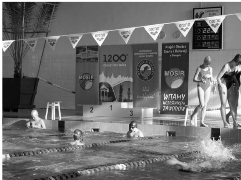
Walka o medale była bardzo zacięta

Wszystkim wyróżnionym serdecznie gratulujemy! BZ