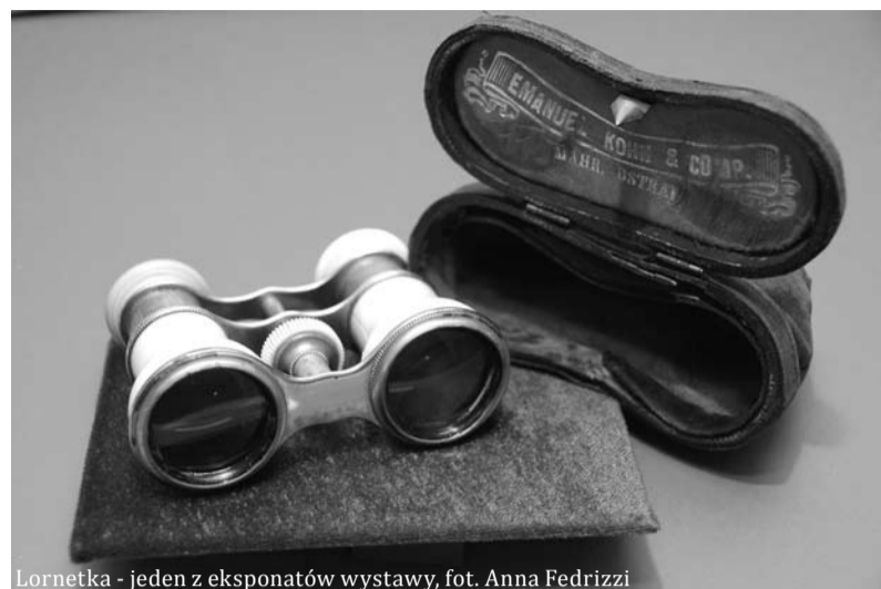
Lornetka - jeden z eksponatów wystawy

Pomiędzy eksponatami co i rusz można zobaczyć bilecik z jakimś te-