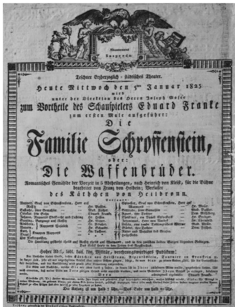
Afisz teatralny z I poł. XIX w.