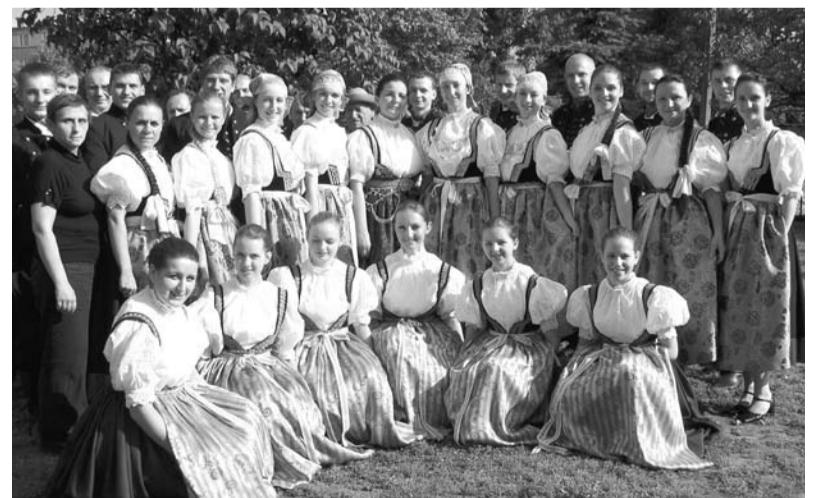
Zespół Pieśni i Tańca