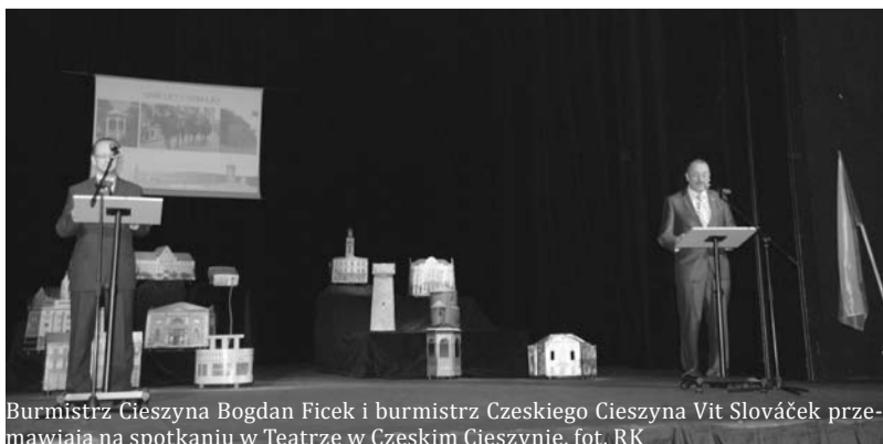
Burmistrz Cieszyna Bogdan Ficek i burmistrz Czeskiego Cieszyna Vít Slovák przemawiają na spotkaniu w Teatrze w Czeskim Cieszynie