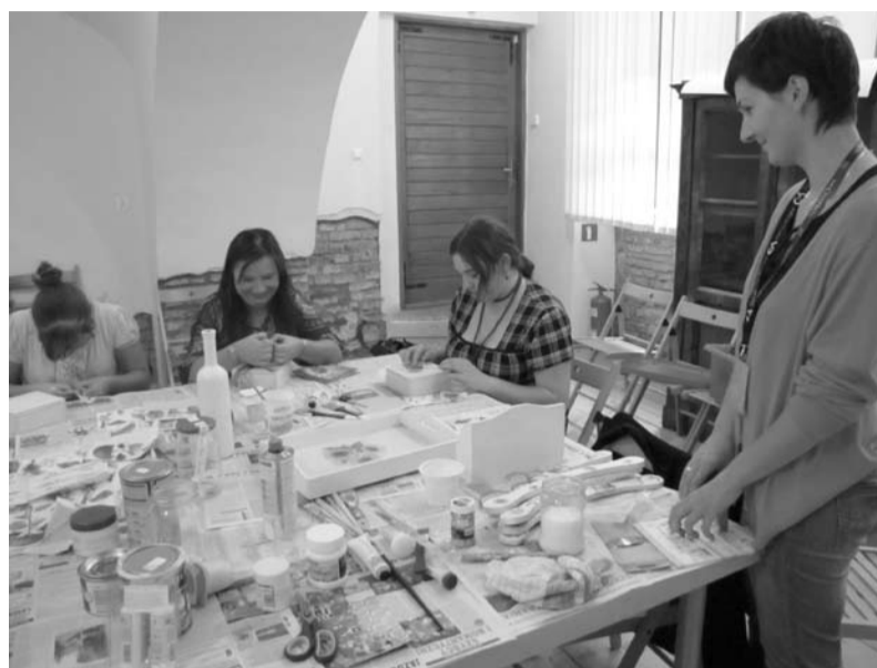
Zainteresowaniem cieszyły się m. in. warsztaty decoupage