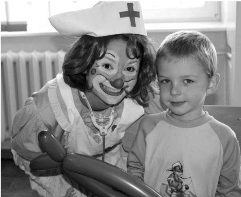
Dzieci w doskonałych humorach poznawały szpital w towarzystwie klaunów, fot. B. Karnas-Greń