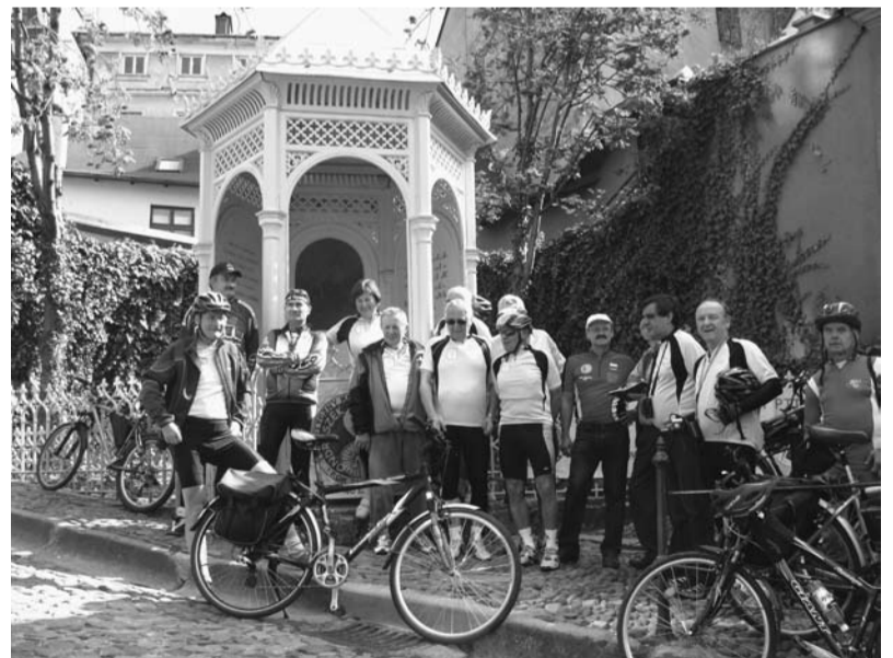
Kolarze licznie zgromadzili się przy Studni Trzech Braci