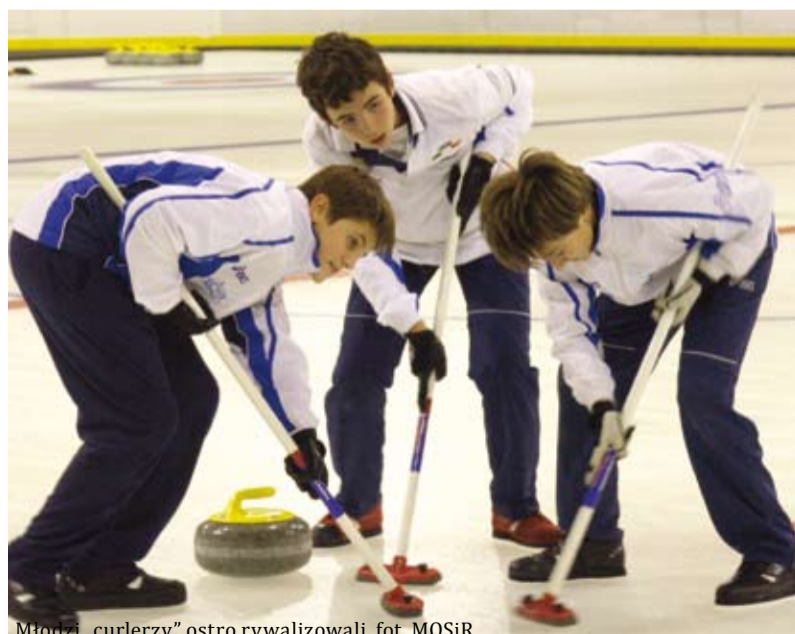
Młodzi „curlerzy” ostro rywalizowali, fot. MOSiR

Tych, którzy nie zdążyli na turniej Olympic Hopes, a chcieliby zobaczyć o co chodzi w curlingu, zapraszamy w dniach 15-17 października na Mistrzostwa Polski Seniorów.