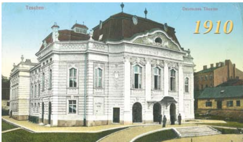
Budynek Teatru Niemieckiego przy Placu Koszarowym (fotografia z pocztówki z roku 1912; Muzeum Śląska Cieszyńskiego)