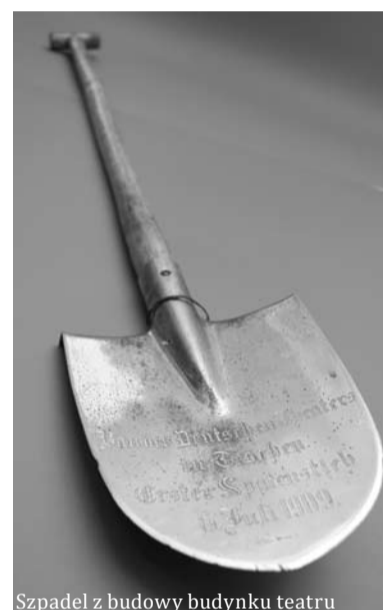
Szpadel z budowy budynku teatru