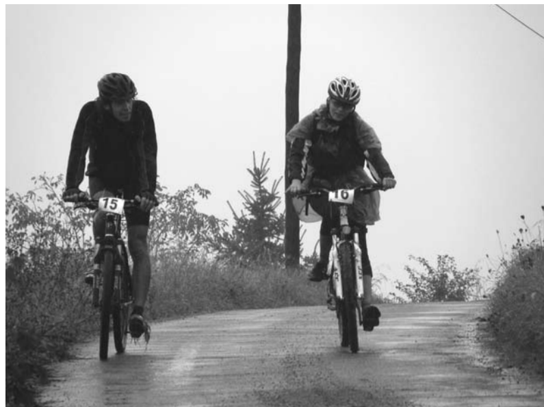
Zawodnicy zmagają się z trudnościami trasy