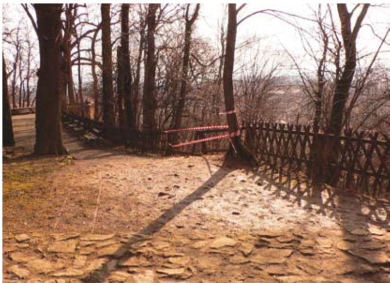
Na zdjęciach: Góra Zamkowa przed i po rewitalizacji