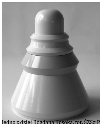
Jedno z dzieł Bogdana Kosaka

29 października 2010r. o godzinie 12.00 w Basteji Śląskiego Zamku Sztuki i Przedsiębiorczości odbędzie się otwarcie wystawy znanego, polskiego ceramika Bogdana Kosaka pt. „Urna - Naczynie / Naczynie - Urna”.