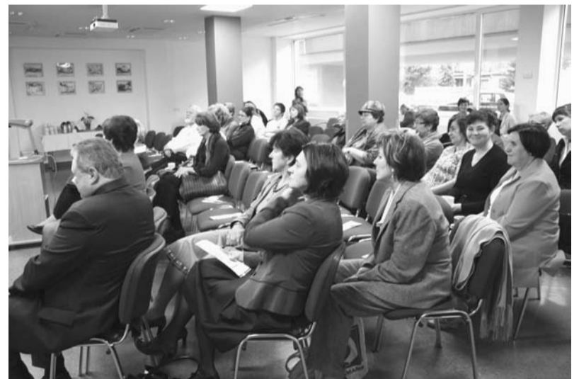
Uczestnicy Forum Kobiet