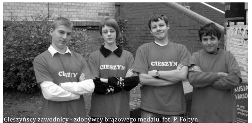
Cieszyńscy zawodnicy - zdobywcy brązowego medalu